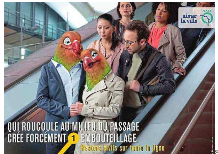
Campagne d'affichage de la RATP en 2013.