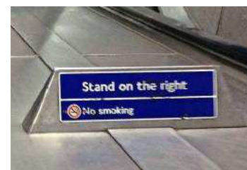
A Londres, de nombreux panneaux invitent à « rester sur la droite ».

En me dirigeant vers les quais du RER E, bien plus profonds, à la montée comme à la descente, je suis rappelé à l'ordre dès les premiers mètres : « vous pouvez avancer s'il vous plaît », me demande poliment l'une, « poussez-vous sur le côté », m'intime un autre, plus directif. C'est l'occasion de me rendre compte à quel point je gêne : entre le moment où je libère la « voie rapide » et le haut de l'escalator, j'ai été doublé par plus d'une cinquantaine de personnes. G.P.