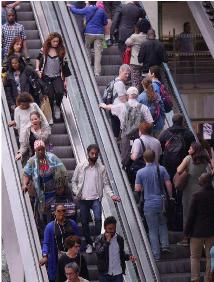
Gare du Nord, mardi. Il ne faut pas attendre longtemps avant d'apercevoir quelqu'un en flagrant délit de stationnement gênant, au grand dam des voyageurs plus pressés.

Quant à la SNCF, elle a essayé (avec succès) de détourner une partie des utilisateurs du métro de Lyon d'un escalator... vers l'escalier se trouvant juste à côté à l'aide de couleurs vives